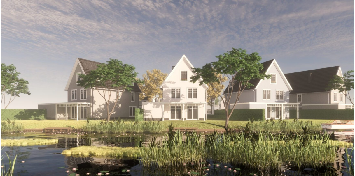
Impressie van een bouwplan met luxe villa's elders in Nederland.

De VVD Hollands Kroon is wel voorstander van collectief particulier opdrachtgeverschap (CPO). Daarom ondersteunen we initiatieven op dit punt; van jongerencomplex tot 'knarren hof'. Het is een goede manier om de samenstelling van de bevolking in de dorpen dynamisch te houden.