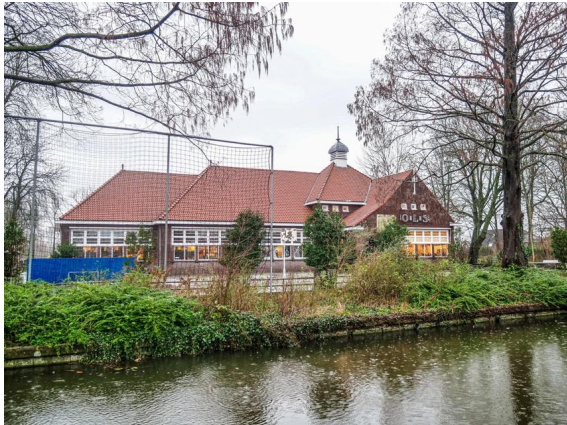
De Snip in Nieuwe Niedorp, monumentaal maar duurzaam

Onderwijs is investeren in de wereld van het kind. Elk kind verdient gelijke kansen, een veilige plek en ruimte om zich te ontwikkelen. Daarom willen we investeren in moderne, duurzame en kindvriendelijke scholen, waar aandacht is voor welzijn, gezondheid, klimaat en sociale veiligheid. Zo bouwen we samen aan een toekomst waarin elk kind zich gezien en gesteund voelt.